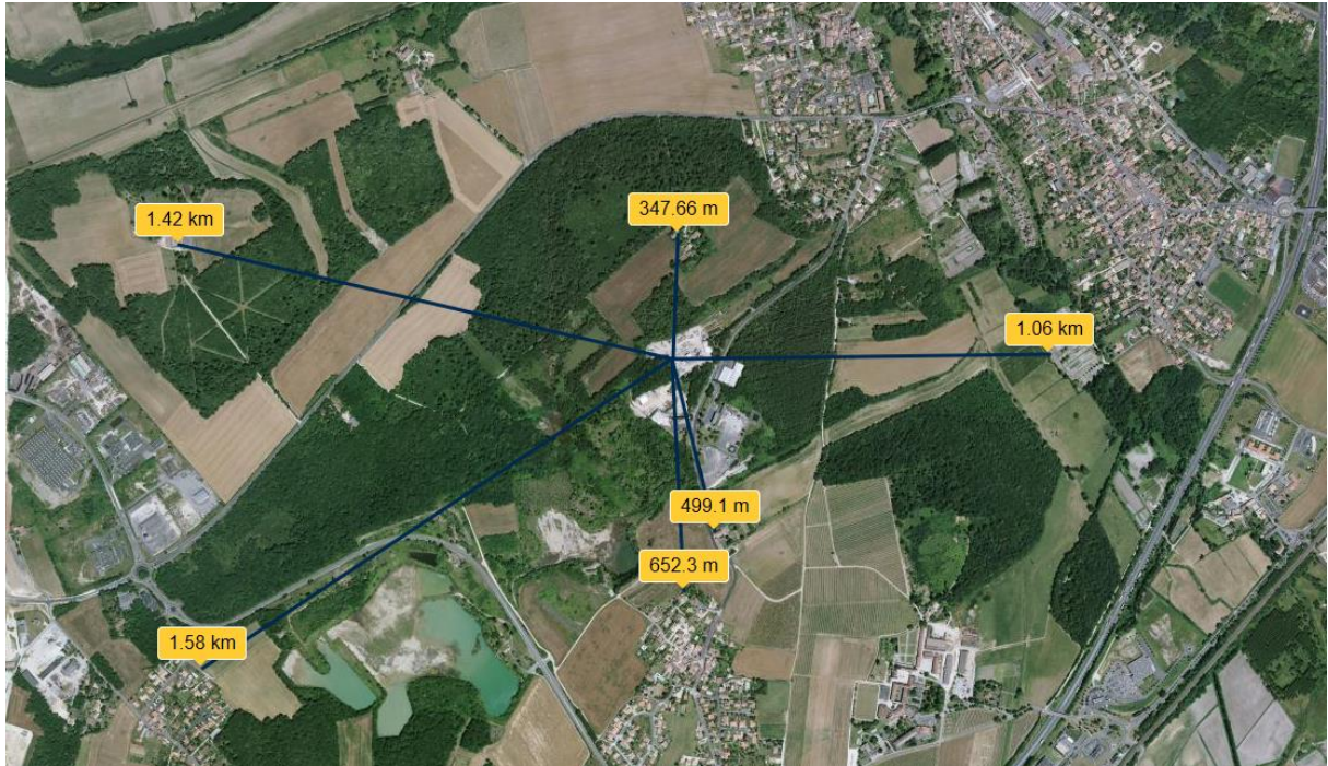
Carte 1 : Voisinage de l'Entreprise SABATIER